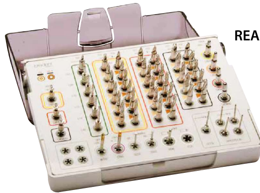
SKY pro guide OP tray

20% Sie sparen 1.529 € Aktionspreis 6.116 €